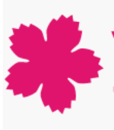
(het Vechtdal logo)

Langs de Vecht komt van oudsher een heel specifieke flora voor met als vaandeldrager de Steenanjer. Hier ter plaatse ook wel liefkozend Vechtdalanjer genoemd.