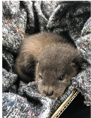
Jonge otter opgevangen