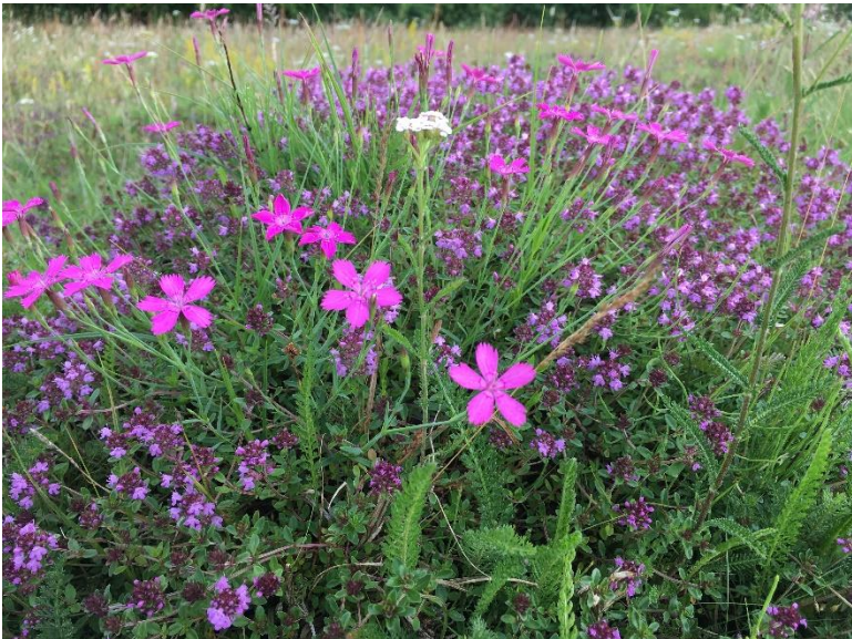
Een kleurenfestijn van steenanjer en grote tijm in juni/juli.