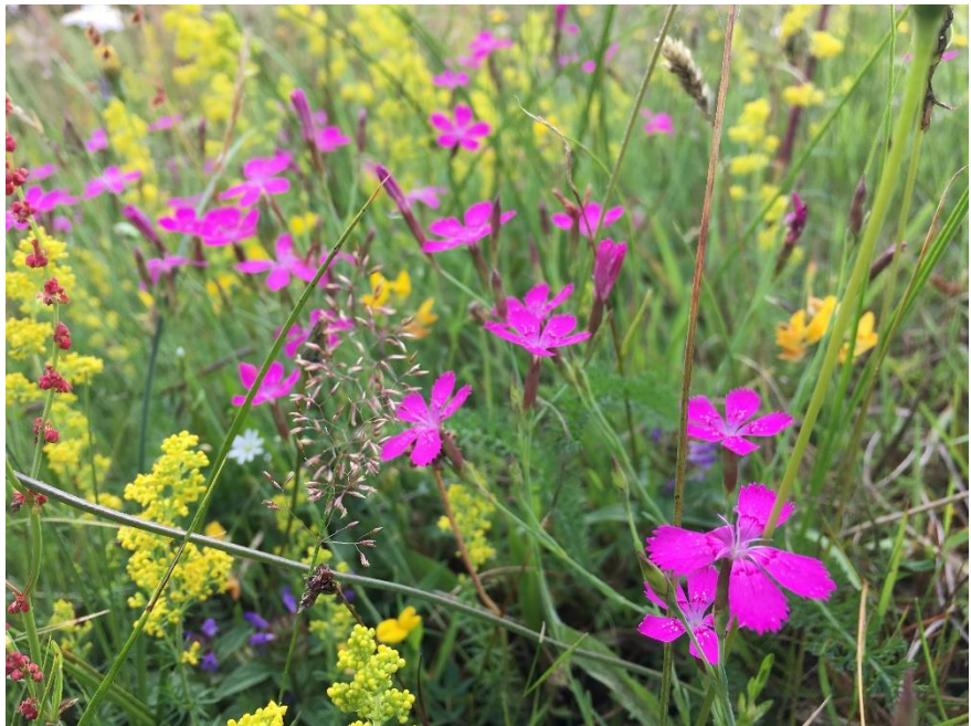
Steevanjer (roze) en geel walstro

Door allerlei redenen is deze specifieke flora zeldzaam geworden.