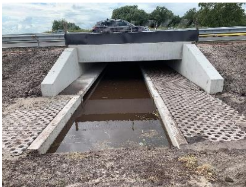
Faunapassages, speciaal voor otters

Helaas zijn er in Overijssel in 2021 ca 22 otters dood gereden.