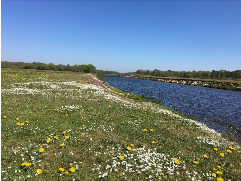
Stroomdalflora in april met o.a. Akkerhoornbloem (wit) Gewone reigersbek (roze).

een dag stevig doorgewerkt om zaaibedden te maken en vervolgens diverse inheemse plantensoorten te zaaien en te planten. Nu is het grote wachten begonnen. Hoe gaat het zich dit voorjaar /zomer ontwikkelen?