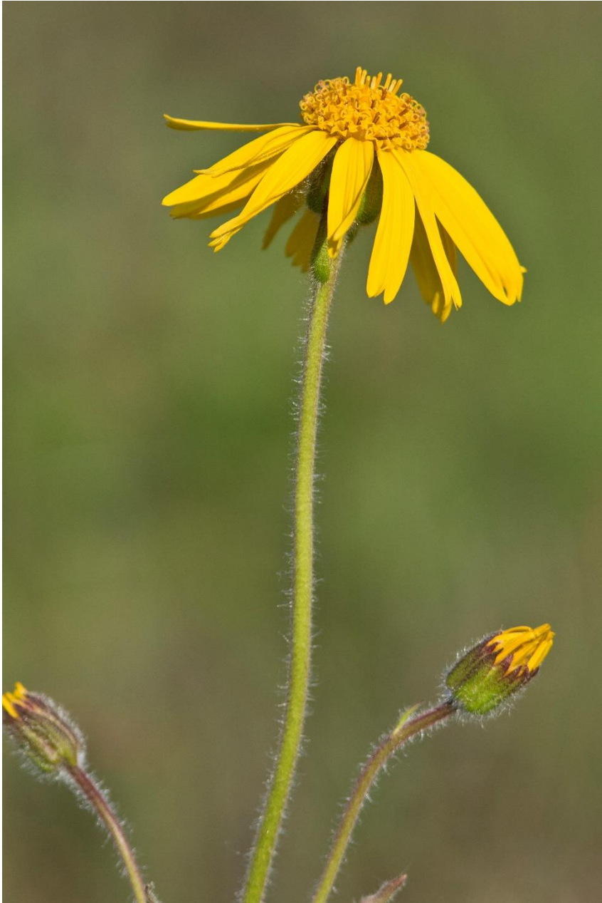
Ook dit jaar kwam de prachtige Wolverlei . Arnica montana weer tot bloei in het Varsenerveld. Zie voor een uitgebreide beschrijving het jaarverslag van 2020