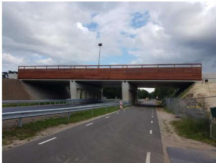
Ecoduct Vlierbelten in aanbouw

Het ecoduct Vlierbelten over de vernieuwde N340 in Varsen is bijna klaar. Het wordt een prachtige voorziening! In het Vechtdal kunnen hier straks kleine en grote beesten weer veilig migreren van zuid naar noord en vice versa. De eigenaar van de het aanliggende landgoed "Den Woesten Heide", meldde ook al de eerste sporen die hij had gevonden, helaas niet van beesten maar van crossmotoren! Voor insecten en andere dieren, is het erg belangrijk dat er de juiste beplanting komt, inlandse soorten zijn daarbij cruciaal. Maar ook om te voorkomen dat er bv ATB-ers en/of crossmotoren illegaal gebruik maken van deze oversteek voor dieren, is het slim om struiken met scherpe stekels, zoals hulst, gaspeldoorn, slee- en meidoorn aan te planten. Daardoor zorg je voor een optimaal gebruik van deze faunaoversteek door soorten waarvoor het is gemaakt. Ook zal er in de omgeving en op het ecoduct zelf voldoende rust gecreëerd moeten worden!