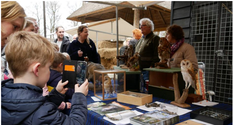
Lammetjesdag 2018

Aan beide organisaties zijn weer verschillende diensten verleend. Onder andere inventarisatie, controle en ringen van de Ooievaarsjongen, Klapekstertelling, Nachtzwaluwtelling. Ook is er op de lammetjesdag weer een stand ingericht.