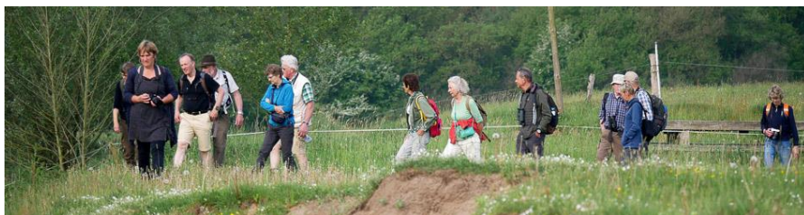
Zwerftocht 12 mei 2018