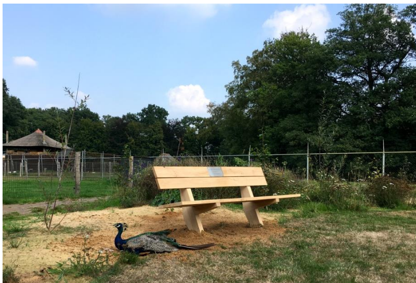
SBB Bankje t.g.v. van ons 50 jarig jubileum in de vlindertuin. (Wauw, zei de Pauw)