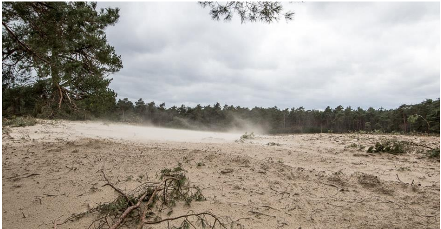
Sahara Ommen (foto: Martien Naarding)

Voor de activiteiten van deze werkgroep wordt verwezen naar de paragraaf "beleid in uitvoering" in het algemene deel van het jaarverslag.