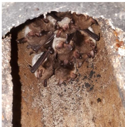
Franjestaarten met jongen

Zoals ook in voorgaande jaren worden de vleermuiskasten nog regelmatig gebruikt als nestkraakpand door meerdere vogelsoorten: deze vogelsoorten nemen we uiteraard niet mee met de vleermuistelling. In de maand juni zaten er wespennesten in vier kasten.