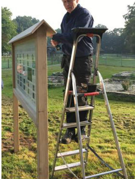
Louis van Vilsteren legt de laatste hand aan een prachtig informatiebord.