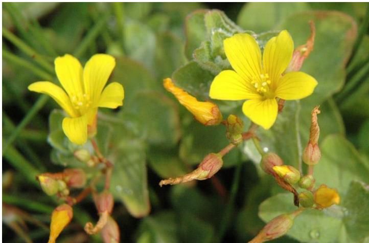
Moerashertshooi. Een plantje met een duidelijke maggi-geur.